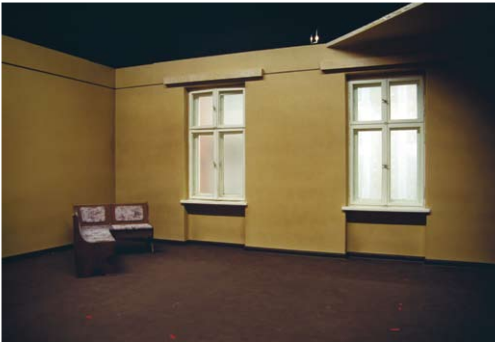
Abbau I, 2004 Fotografia // Fotografia 180 x 261 cm

no estic segur de fins on podem arribar amb aquesta metàfora dels residus. Les bosses d'escombraries de Noguero, que en aquesta exposició es mostren com a figura, són d'un altre ordre. No esperen de cap de les maneres ser llençades a l'abocador, sinó que aparentment retenen les restes fragmentades d'una figura meditativa de la pròpia creació i destrucció de Noguero, de presència efímera i possible tema renaixent, segons la prerrogativa del creador. En aquest sentit, aquestes bosses podrien contenir les llavors d'una nova figuració, i amb ella una nova humanitat; o de la mateixa manera podrien considerar-se urnes per a les restes acumulades de la figura.