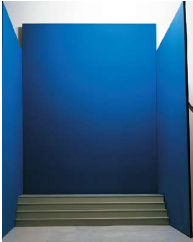
Escenografía para un despliegue I, 2007 Fotografía // Fotografía 150 x 120 cm

Las fotografías de esta exposición de escenografías en un estudio de televisión en Berlín enfatizan esta idea, en tanto que no hay actores esperando la señal para entrar en escena. Moviéndonos por estos platós de ficción televisiva y a través de ellos y vaciándolos de prestidigitación narrativa, Noguero trata otra área donde se evoca el neobarroco en relación con la forma contemporánea, donde la magnificencia alborotada (Panofsky) se prioriza frente a la serenidad concentrada. La televisión popular es un medio que se complace con la composición de imágenes hiperbólicas y devoradoras, con magia narrativa y tecnológica pensada para absorber al espectador de unas maneras que –remontándonos al barroco como instrumento del dogma de la Contrarreforma– acaban por comprometer la libertad individual y neutralizar la capacidad crítica.