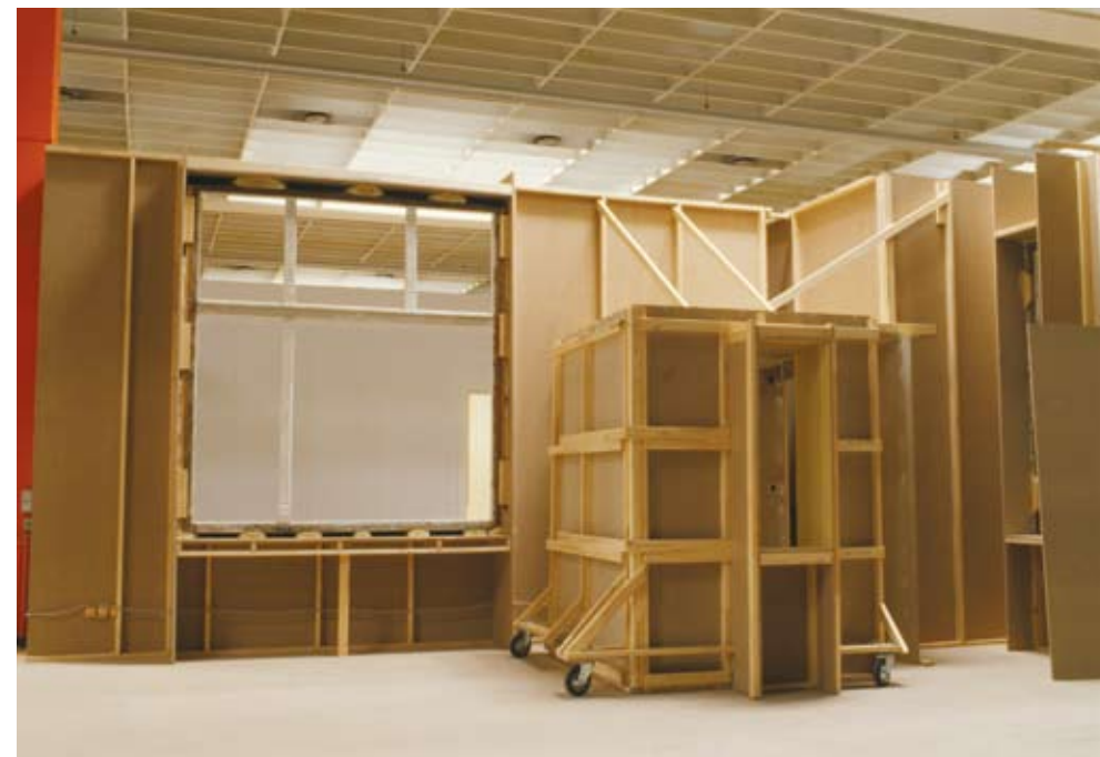
Weißes Kinderzimmer mit Speisekammer, 2004 Fotografia // Fotografia 180 x 261 cm

Así pues, el movimiento no está en la imagen misma, que tiende al silencio, sino en los cambios constantes del artista en formato, escala y citación histórico-cultural. Este movimiento no constituye una acción narrativa, porque tiene más que ver con el método creativo. Pretende señalar la naturaleza provisional y frágil de cada unidad (cada pieza de arte) y desprendernos de la tentación de quedar absorbidos o atraídos por esta o aquella otra topología. Noguero se mueve de una manera y de otra, de aquí hacia allá, multiplicando puntos de vista, al tiempo que cambia constantemente la