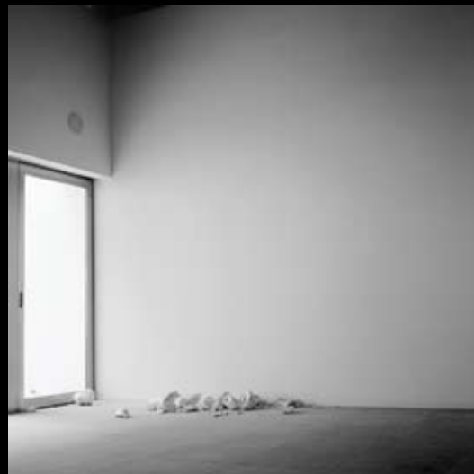
Frage II, 2008 Fotografia // Fotografía 90 x 90 cm