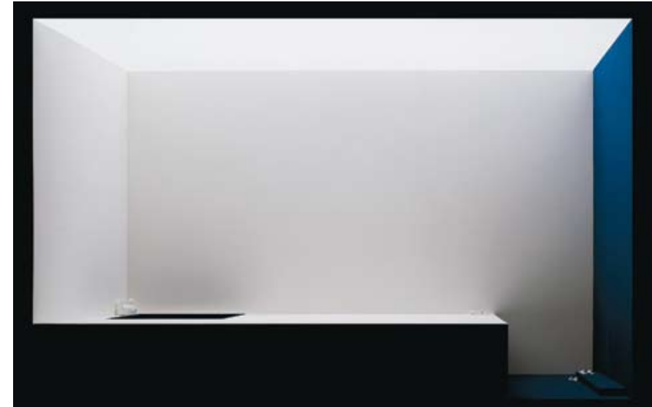
In seinem Mund o asomada , 2007 Fotografía // Fotografia 112 x 160 cm

Dicho esto, parecía como que hubiera muchos puntos de coincidencia entre la obra de Noguero y otros artistas españoles identificables con los preceptos estéticos y los valores críticos del neobarroco. En mi opinión, esta asociación es perfectamente legítima; su obra todavía mantiene una cierta coherencia con determinados preceptos neobarrocos, por mucho que hayan sido borrados del discurso común, a la vez que redirigidos legítimamente hacia la crítica