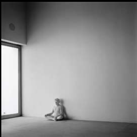
Frage I, 2008 Fotografia // Fotografía 90 x 90 cm